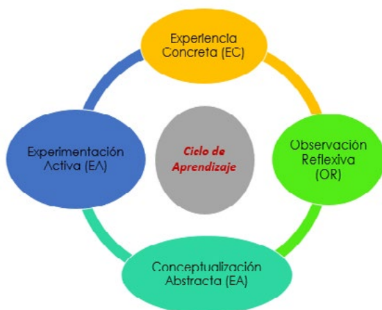
Figura 2. El ciclo experiencial de Kolb, cuatro etapas que comprenden el ciclo de Aprendizaje que sugiere Kolb, cuya relación es íntima y constante.