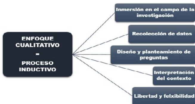
Figura 1. Dimensiones del enfoque cualitativo y lo que implica, descrito en sus cinco dimensiones.