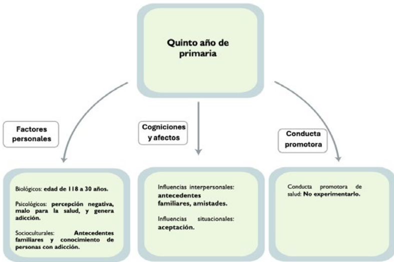
Figura 2. Percepción de los adolescentes de quinto año de primaria respecto al tabaco.