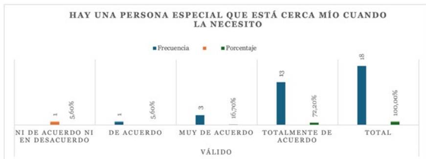
Figura 1. Hay una persona especial que está cerca mío cuando la necesito