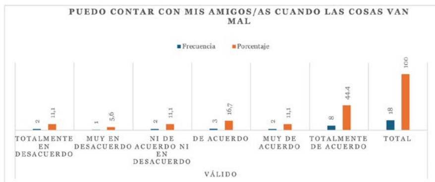
Figura 3. Puedo contar con mis amigos/as cuando las cosas van mal