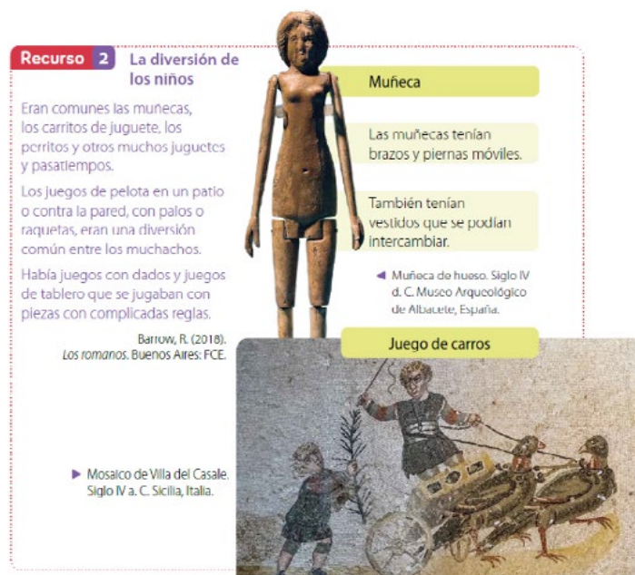
Figura 4. La diversión de los niños

La cuarta evidencia, denominada “La diversión de los niños”, aborda el tema del juego en la infancia romana, ofreciendo una representación aparentemente neutra, pero marcada por estereotipos de género y omisiones sociales. Este recurso permite observar cómo el texto escolar simplifica y descontextualiza la vida infantil, reforzando una visión homogénea y apolítica de la niñez en el pasado.