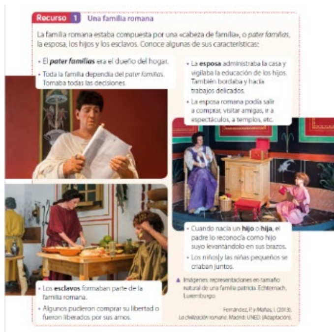
Figura 2. Familia romana