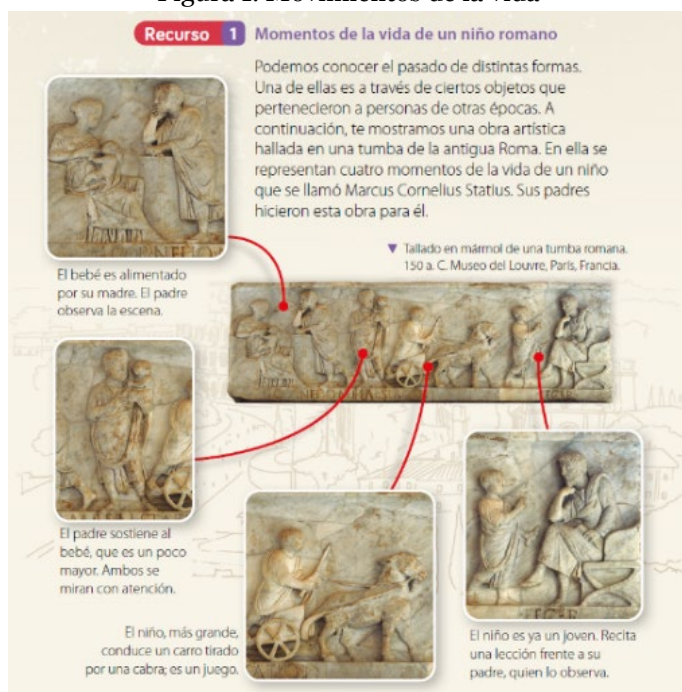
Figura 1. Movimientos de la vida