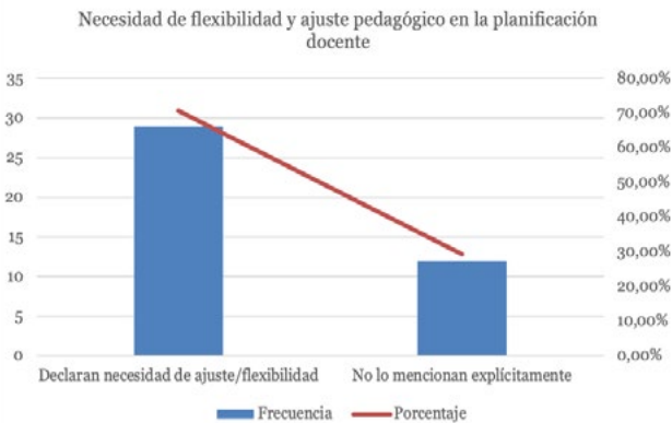
Figura 3. Frecuencias sobre la necesidad de flexibilidad y ajuste de la planificación docente Nota: elaboración propia

En el afán de analizar el valor asignado a la flexibilidad en la planificación docente, se identificaron y sistematizaron las respuestas cuyo eje estuvo en la necesidad de tomar decisiones sobre la adaptación de las planificaciones durante el desarrollo de las clases. A continuación, se presenta la figura 3, que condensa la distribución de frecuencias sobre este aspecto.