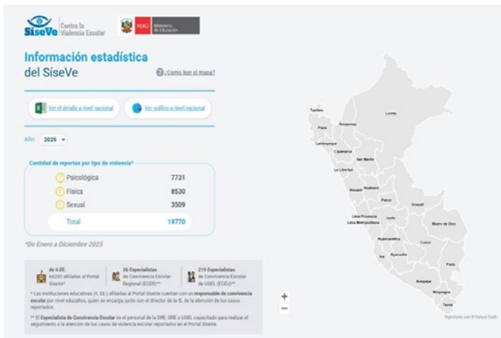
Figura 1. Información estadística del SISEVE

Nota: Plataforma SISEVE nacional Minedu (2025).