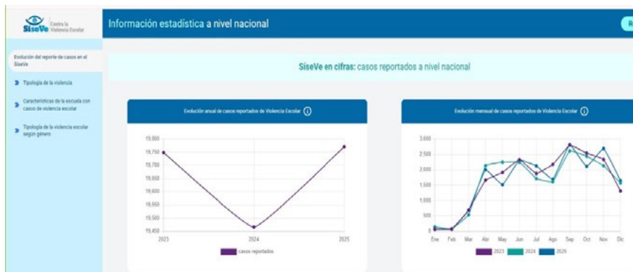
Figura 2. Información estadística a nivel nacional

Nota: Plataforma SISEVE nacional Minedu (2025).