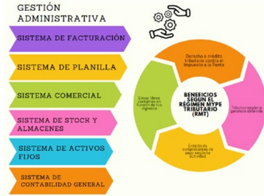
Figura 2. Modelo de gestión administrativa para la formalización de las micros y pequeñas empresas