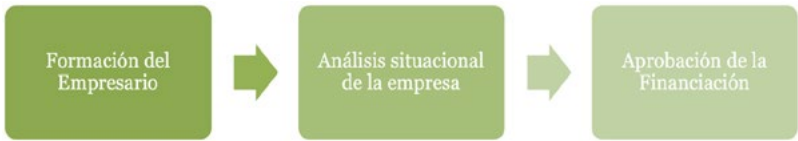
Figura 4. Modelo financiación empresarial Nota: elaboración propia a partir de resultados de la investigación

El modelo se aterriza a partir de las siguientes particularidades